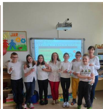
Detičky si urobili aj kvíz „Koľko toho vieš o mlieku“ menšie deti robili kvíz spolu.