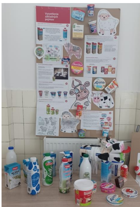
Žiaci v ŠKD nám vyrobili z tetrapaku kravičku a krásne výtvyry, ktoré sme vystavili v jedálni ;)