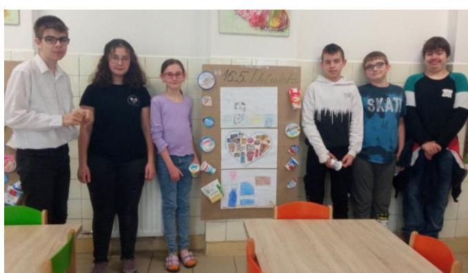
Žiakom mliečko a jogurty chutia ☺